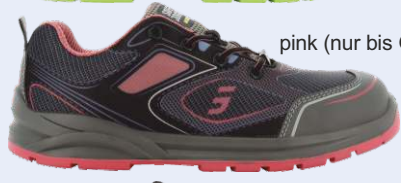
pink (nur bis Gr. 42)